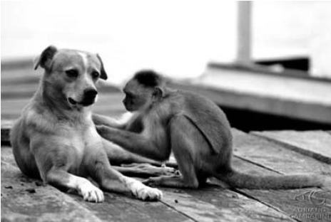
Cachorro e macaco-prego num tapume, à beira do Rio Negro, AM.

http://gambarini.com.br/blog/2009/03/26/cenas-curiosas-156793/